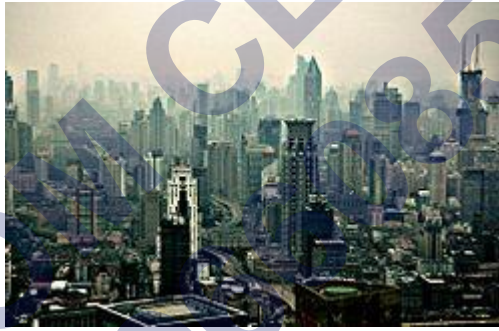
पुक्सी (Puxi) शंघाई के बगल में, चीन।

वैश्वीकरण का शाब्दिक अर्थ स्थानीय या क्षेत्रीय वस्तुओं या घटनाओं के विश्व स्तर पर रूपांतरण की प्रक्रिया है। इसे एक ऐसी प्रक्रिया का वर्णन करने के लिए भी प्रयुक्त किया जा सकता है जिसके द्वारा पूरे विश्व के लोग मिलकर एक समाज बनाते हैं तथा एक साथ कार्य करते हैं। यह प्रक्रिया आर्थिक, तकनीकी, सामाजिक और राजनीतिक ताकतों का एक संयोजन है। वैश्वीकरण का उपयोग अक्सर आर्थिक वैश्वीकरण के सन्दर्भ में किया जाता है, अर्थात् व्यापार, विदेशी प्रत्यक्ष निवेश, पूँजी प्रवाह, प्रवास और प्रौद्योगिकी के प्रसार के माध्यम से राष्ट्रीय अर्थव्यवस्था का अन्तरराष्ट्रीय अर्थव्यवस्थाओं में एकीकरण।